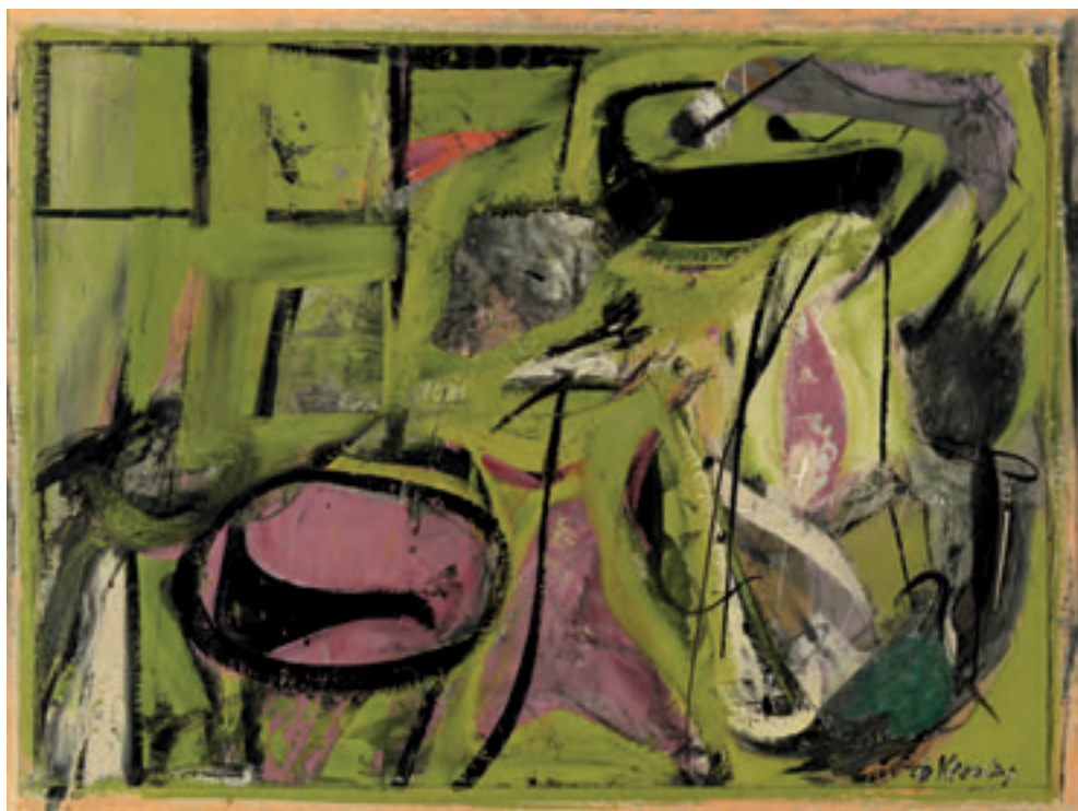
Event in a Barn , 1947, Willem de Kooning. Sotheby's Nueva York

en buscar financiación para la película, que comenzó a filmarse en el invierno de 2002.