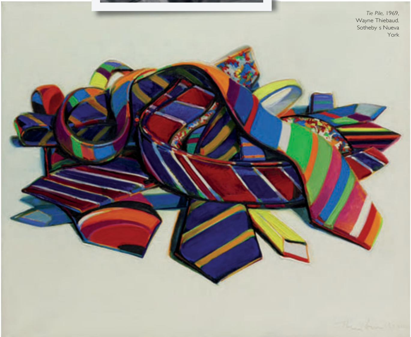
Tie Pile, 1969, Wayne Thiebaud. Sotheby's Nueva York

El arte tenía que decirle algo para que él deseara poseerlo. Le atraían las obras duras, a menudo oscuras y complejas, no necesariamente bonitas. Willem De