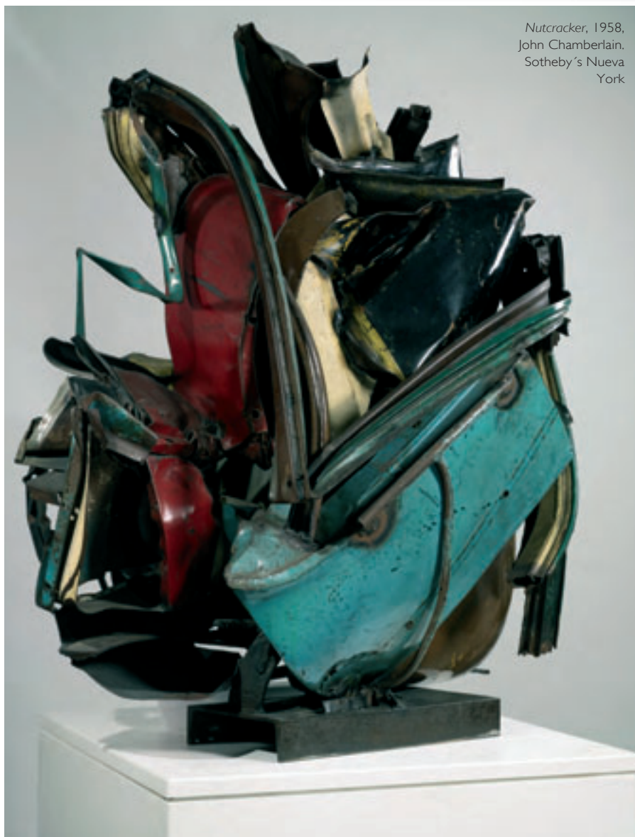
Nutcracker , 1958, John Chamberlain. Sotheby's Nueva York